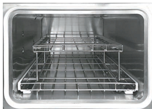
Camera con ripiano intermedio removibile

Dimensione Armadietto con ruote bloccabili 535 x 777 x 700 mm